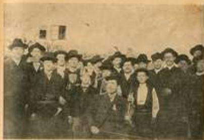
Crasljanka pevacka družina sa svojom učiteljom.