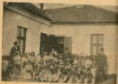
Učenici osnovne škole u Craslju pred školom.