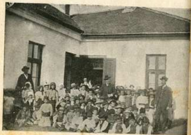
Ученици основне школе у Црљенцу пред школом.