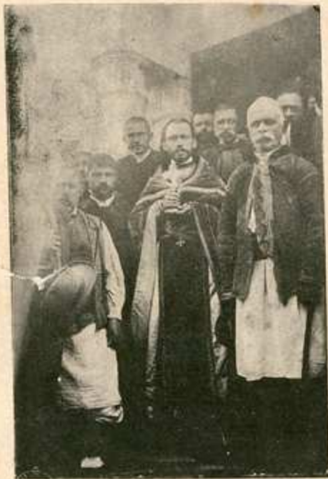
Црљенчани са свештеником пред својом црквом.

Црљенчани воле и српску песму. Зато су основали певачку дружину . Па