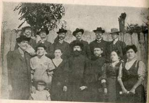
Свештеници и учитељи из Црљенца и околине.

могу и треба Црљенчани да ураде, па да им буде још и боље, те да они и њихови буду још задовољнији и срећнији.