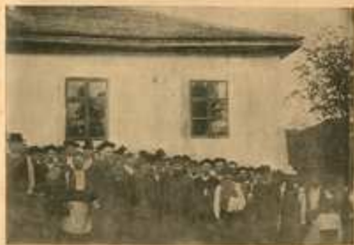
Početni jednog predavanja za narod u Craslju.