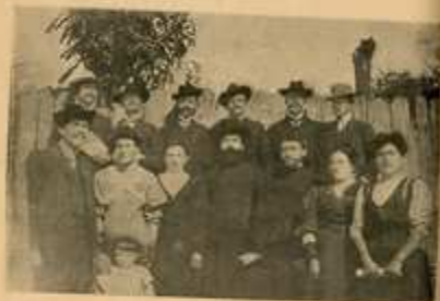
Свештеници и учитељи из Црвенице и околнине.

kojih je jedan bio čak i iz bratske nam Poljske, jesenac otisao u Crvenicu, da vidi to selo, o коме je toliko dobrog slušao.