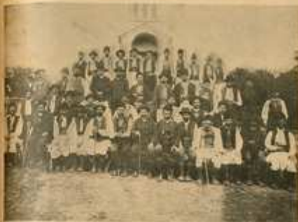
Кметова црљенчине црквице.

рукама, нићи се казиве око тога, ко ће бити кмет, а ко биром. Него се о свему братски договарају, па раде онако, како већина рекне да је добро. Разум-