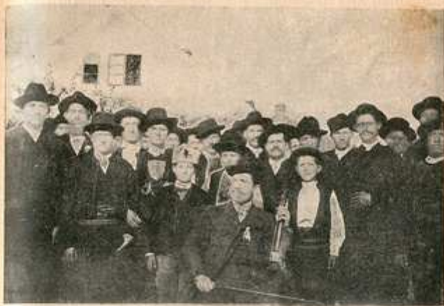
Црљеначка певачка дружина са својим учитељем.