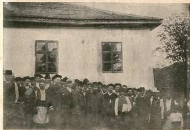
После једног предавања за народ, у Црљенцу.