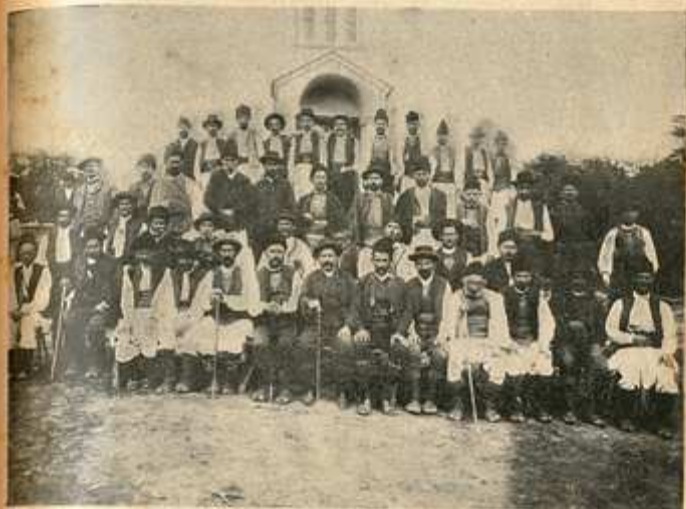
Ктитори црљеначке цркве.

рукама, нити се кавже око тога, ко ће бити кмет, а ко биров. Него се о свему братски договарају, па раде онако, како већина рекне да је добро. Разум-