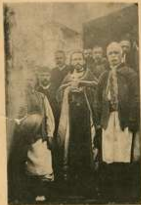
Црљенчани са свештеником пред својом црквом.

звоник налазе на стрелишту и тамо се вежбају у гађању. Црљенчани воле и српску песму. Зато су основали Величку Друштву . Па