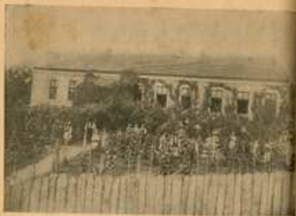
Основна škola u Pralniku i vinograd pred školom.