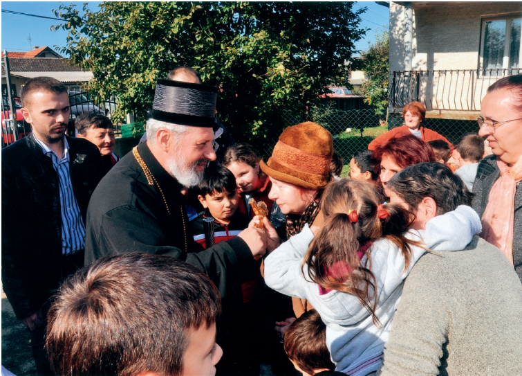
Порта храма Божијег Св. Никола, Велико Црниће, Епископ браничевски господин Игњатије, благосиља присутне