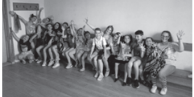
Млади глумци пре почетка представе у веселом расположењу

Након одржане премијере, већ 21. јуна 2022. године, репризу представе „Трапави Алибаба и 40 разбојника“ дивни малишани су извели у Основној школи „Милисав Николић“ у Божевцу. Одушевљење, смех и забава није ни овај пут изостала док су наши најмлађи глумци показивали своје глумачко умеће на сцени.