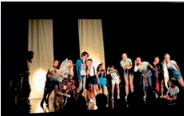
Трајави Алибаба и 40 разбојника, Дечија сцена ОАП „Бранислав Нушић” Мало Црниће