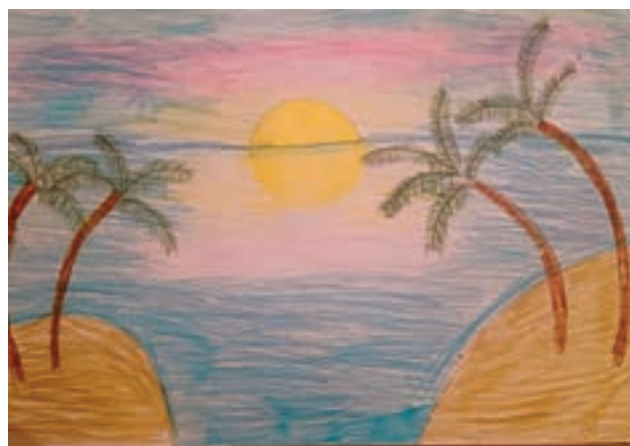
Викторија Сјанојевић, 4. разред ОШ „Милисав Николић”, Божевац