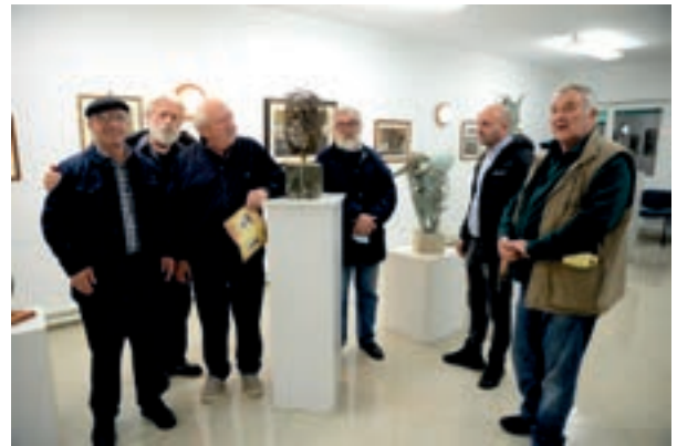
Изложба у оквру 50. ФЕДРАС-а