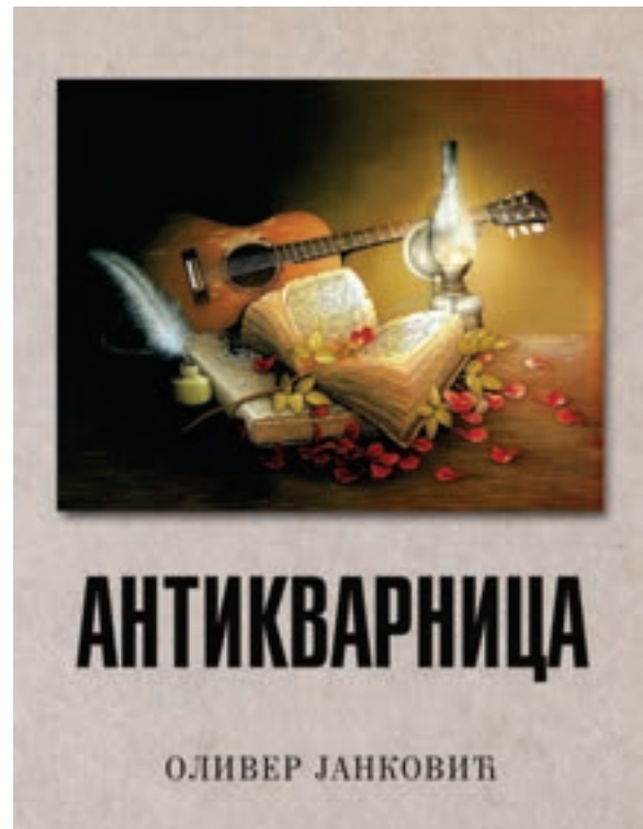
Књије у издању библиотеке „Србољуб Мишић” Мало Црниће