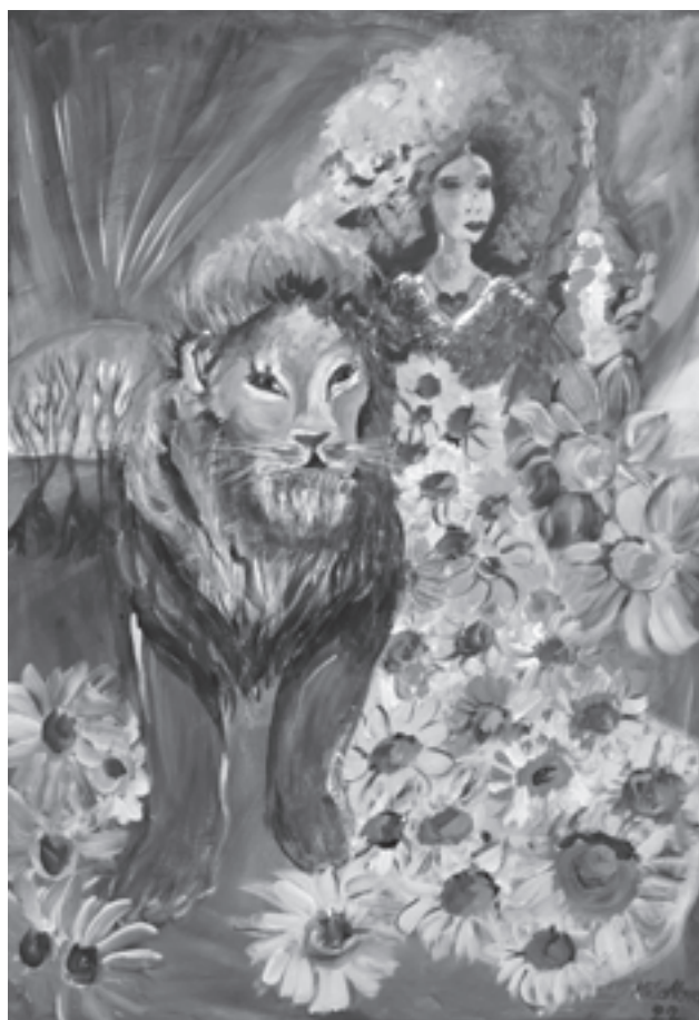
СТИШКА ВИЛА аутор је Данијела МилаНова техника Акрил на џлајну