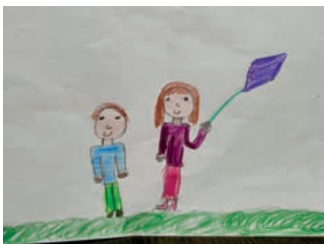
Сара Несћоровић, 1. разред, ОШ „Моша Пијаде”, Мало Црниће