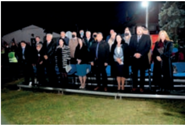
Ошварање јубиларној 50. ФЕДРАС-а