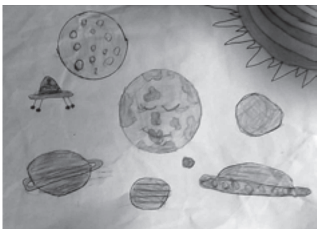
Теодора Пејровић, 4. разред, ОШ „Дража Марковић Рођа”, Шайине