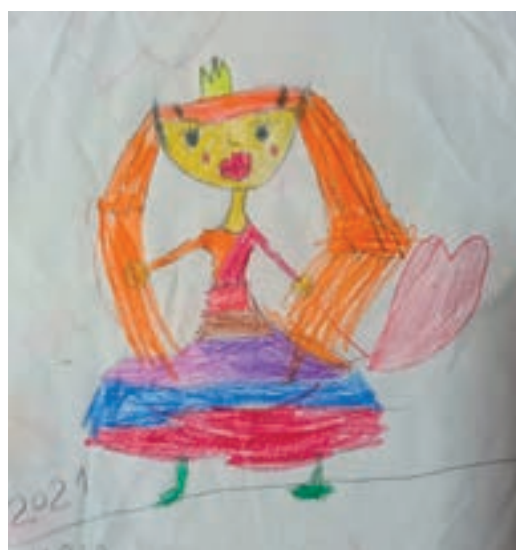
Марија Пејровић, 1. разред, ОШ „Дража Марковић Рођа”, Шайине