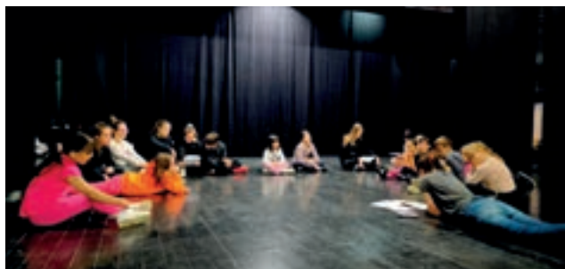
Читање текста на проби